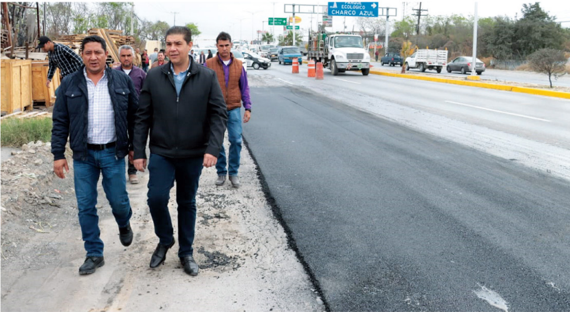
Francisco Treviño, alcalde de Juárez, supervisa los trabajos de recarpeteo.